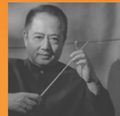
Lü Jia conductor