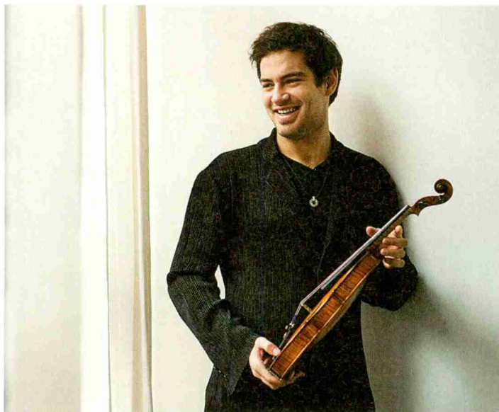
Jung und hochbegabt: Der belgische Geiger Marc Bouchkov tritt am 11. Februar in der Evangelischen Dorfkirche Arosa auf.

Themen-Nr.: 830.002 Abo-Nr.: 3005307 Seite: 31 Fläche: 27'166 mm 2